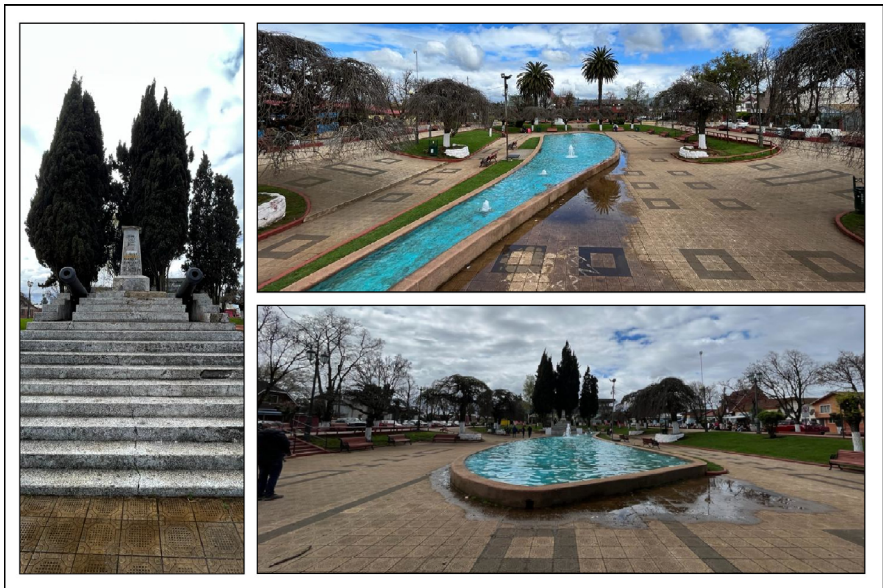
Imagen 5. Izquierda: pedestal sin el busto de Cornelio Saavedra. Derecha: plaza Barros Arana en visita a terreno en octubre 2023. Desnivel hacia la pileta central en el plano horizontal, emulando al valle del río Malleco.