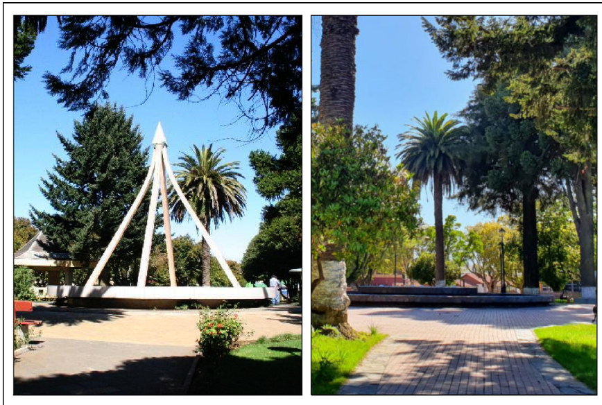
Imagen 1. Izquierda: Lanzas en anterior pileta de la plaza de Armas. Derecha: plaza de Armas tras la remodelación de 2021.