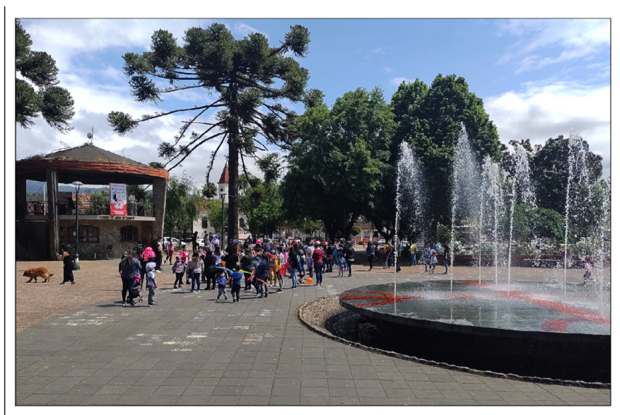
Imagen 3. Plaza de Armas de Purén durante un desfile de estudiantes. Fuente de agua con forma de cultrún a la derecha, araucaria angustifolia al fondo y odeón remodelado a la izquierda.

La centralidad de la plaza está determinada por la presencia escultórica de un cultrún de unos 10 metros de diámetro, que se levanta del suelo aproximadamente 1 metro conformando una plataforma circular elevada y levemente elevada. Sobre su cubierta plana se dibuja el cruce de los ejes y sus respectivos cuatro semicírculos se disponen en correspondencia con las cuatro esquinas de la plaza. Estos ejes responden a la cuadrícula fundacional antes que a la orientación geográfica. De esta superficie emergen 14 chorros de agua, aludiendo a "Los 14 de la fama" 4 , y sirve de