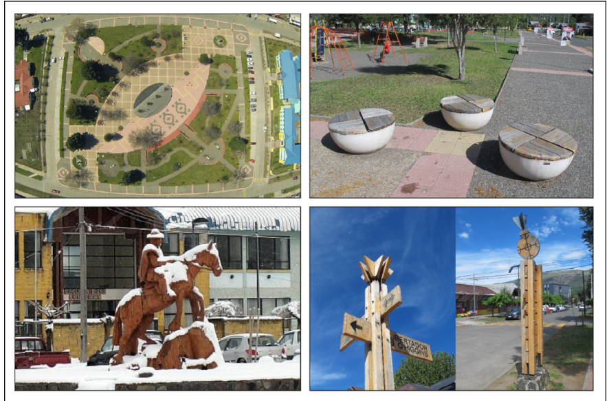
Imagen 4. Izquierda arriba: Vista superior plaza de Armas. Izquierda abajo: Escultura “El arriero” de Idelfonso Quilempán. Derecha arriba: Asientos que evocan al cultrún mapuche. Derecha abajo: Señaléticas que utilizan símbolos y cultrunes mapuche.

La ciudad de Collipulli cuenta con un trazado en damero rotado unos 35° respecto del norte geográfico, respondiendo de manera perpendicular al valle del río Malleco. A diferencia de otras ciudades de la Araucanía, cuyas plazas de armas se encuentran en manzanas cuadradas, la plaza Barros Arana de Collipulli se emplaza sobre una manzana rectangular. Alrededor está configurada por