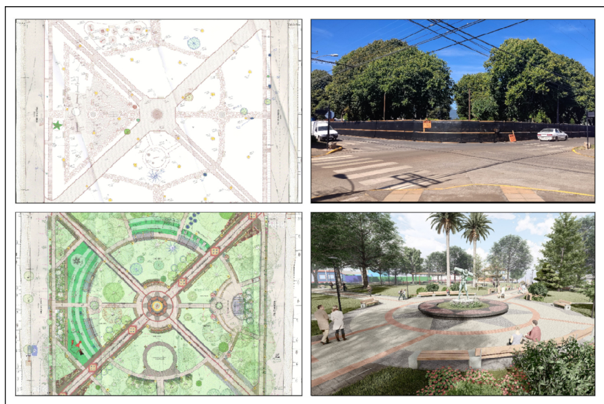
Imagen 2. Izquierda: Arriba, planta original; abajo, planta remodelación. Derecha: arriba, plaza en visita a terreno diciembre 2022; abajo, elemento escultórico en imagen objetivo de la remodelación actual.